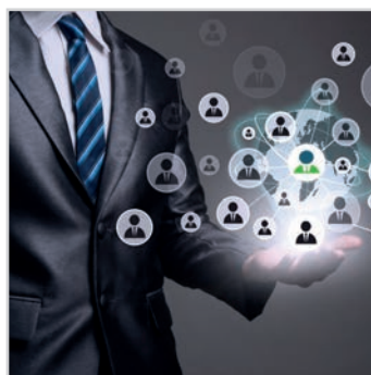
CENTRE D' ACTIONS CRM