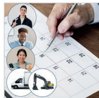
PLANNING DES RESSOURCES